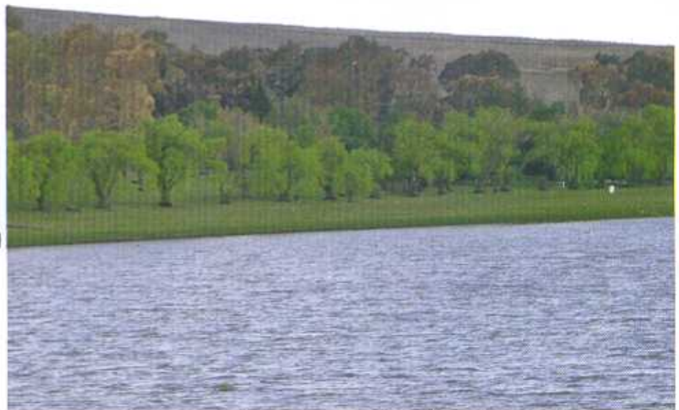
'n Gedeelte van die kampeergronde en hengelower by Grootdam.