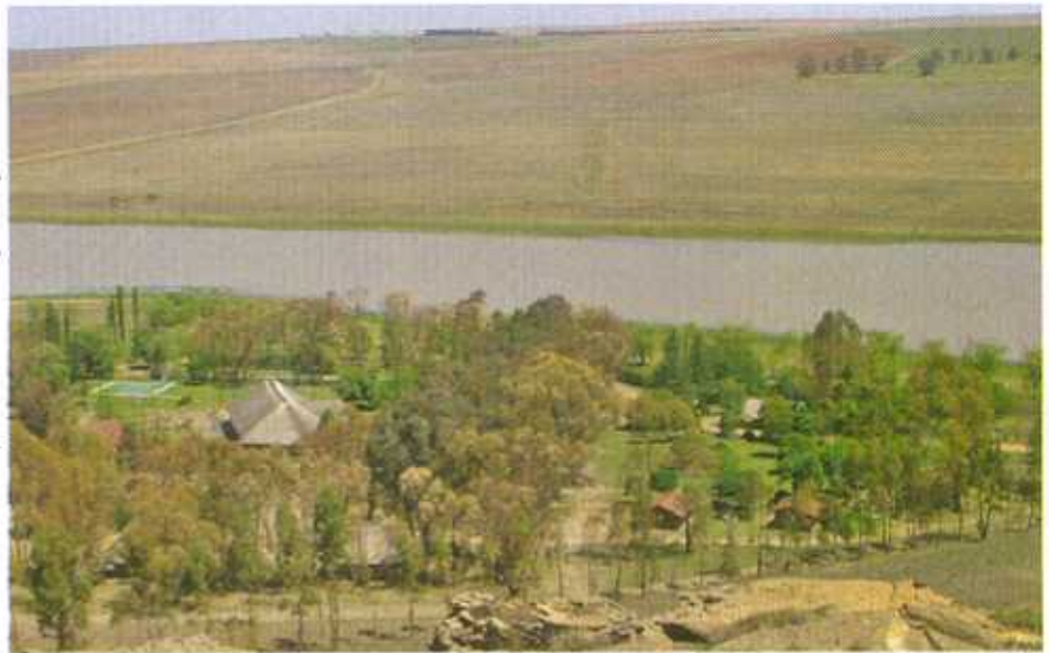
Uitsig oor 'n gedeelte van Grootdam en die Oord.

In Reitz, neem Voortrekkerstraat Ooswaarts tot oor die brug en draai links by die kruising. Ry verby 'Reitz Testing Station' en die gholfbaan op linkerkant. Draai regs teenoor die gholff-klubhuis met die Vrede/Warden pad, gaan oor die treinspoor en draai regs by die Warden-bordjie. Die oord is 5,7 km verderaan op regterkant. Dit is teerpod tot by die oord.